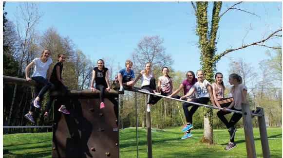
Vorführgruppe Wettkampfkinder 6. -9. Klasse