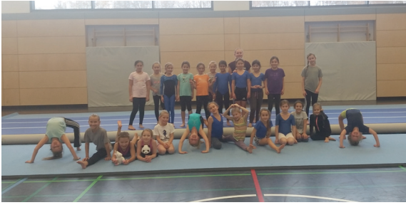
Vorführgruppe Wettkampfkinder 2.-5. Klasse

zusätzlich Choreographien (Tanzen und Turnen).